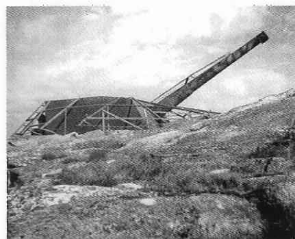
Ovan: Hjuviksbatteriet.